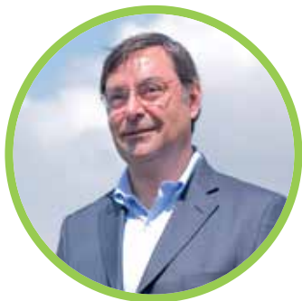
FELIPE GUEVARA STEPHENS ALCALDE DE LO BARNECHEA

“Nosotros creemos que abordar el tema del emprendimiento a una edad temprana es esencial para generar más y mejores emprendedores, que sean una contribución al desarrollo del país.”